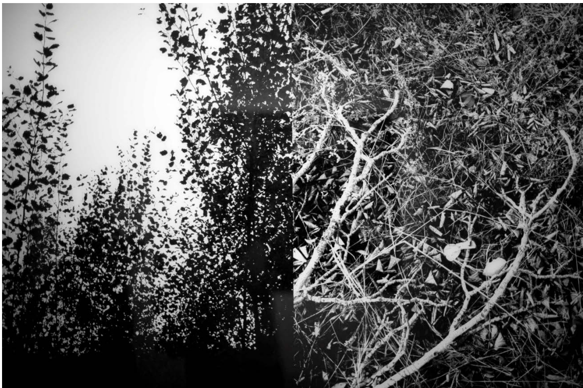
La forêt du Koala (posición 5)