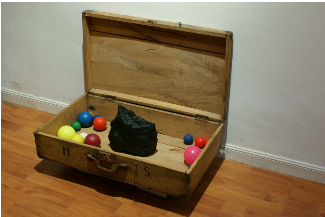
La nuit et les constellations