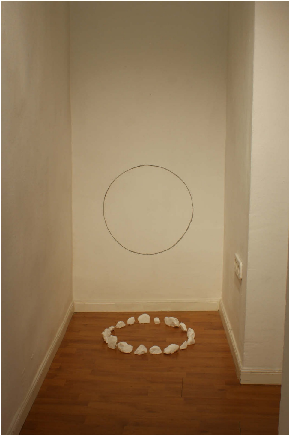
La nuage d'orage

“Las instalaciones hacen referencia a estos tiempos del día o modos de utilizar el bosque, por ejemplo la promenade de l'après-midi (el paseo por la tarde), la tombée du soleil (el atardecer), la noche y las constelaciones, la nube de tormenta. Son momentos importantes para percibir un bosque, una muestra entre otros 500 momentos posibles, y que faltan.”