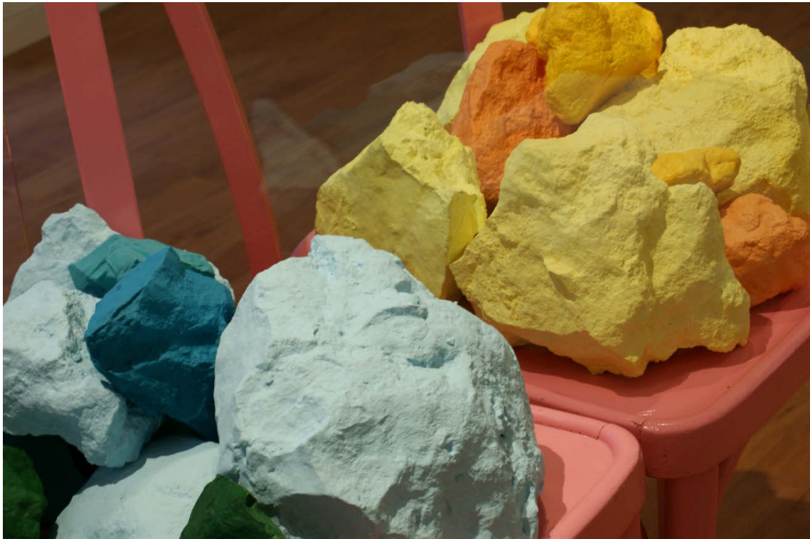
La promenade l'après midi