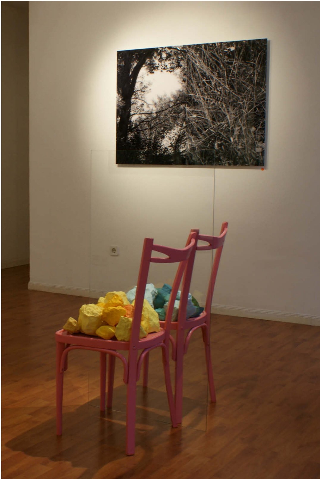
La promenade l'après-midi Y La forêt du Koala (posición 4)