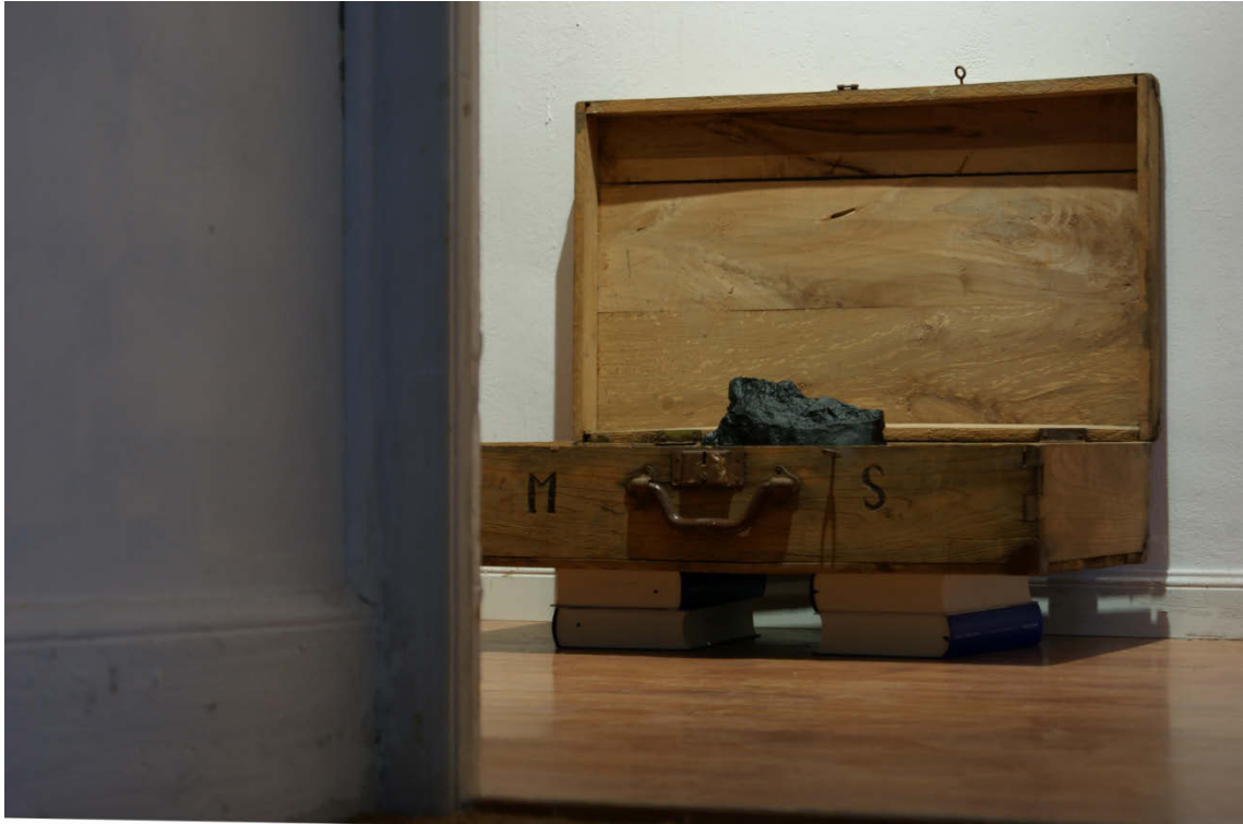
La nuit et les constellations